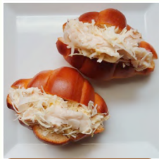
サラダチキンとキャベツのロールパンサンド