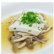
メカジキときのこのレンジ蒸し